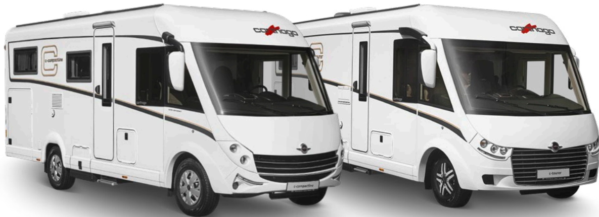
c-compactline Super-Lightweight c-tourer Lightweight