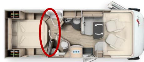
Malibu I 500 QB