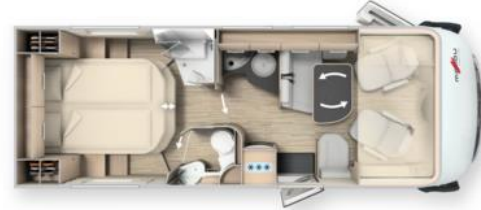
Malibu I 440 QB