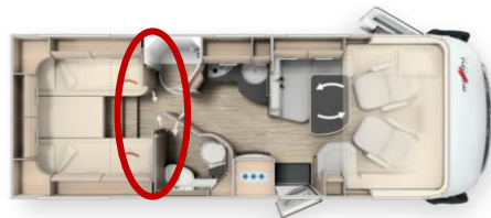
Malibu I 490 LE