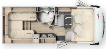
Malibu I 430 LE