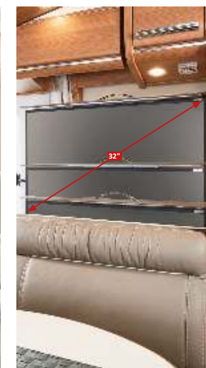
▲ chic c-line I 4.9 LE mit Auszugssystem für 32" TFT-Fernseher hinter Rückenlehne Seitensitzbank in Stilwelt linea moderna und Stilwelt Leder Macchiato mit Option verkürztem L-Schenkel