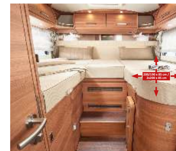
▲ Große Längs Einzelbetten mit ausziehbarer Einstiegsstreppe und Schiebetür zur Raumentrennung in Stilwelt linea moderna (I 4.9 LE, I 4.9 LE L)