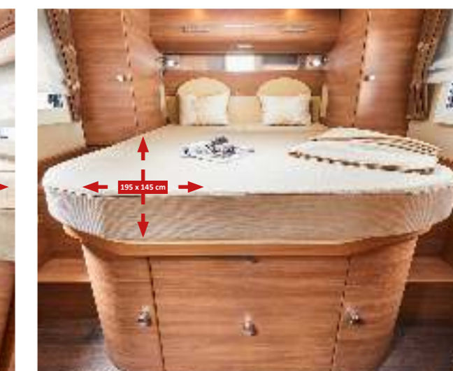
▲ Großes Queensbett mit Auszügen an der Front und seitlichen Kleiderschränken in Stilwelt linea moderna (I 5.0 QB, I 5.0 QB L)