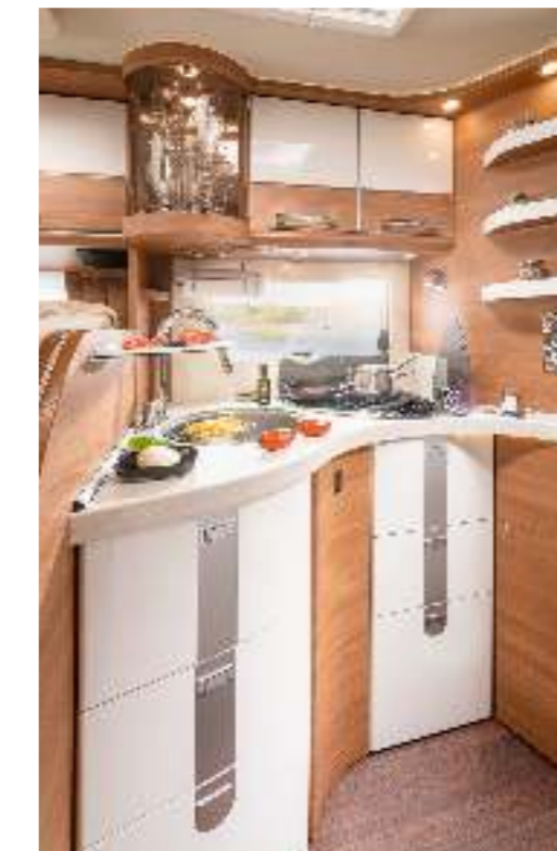
▲ Komfort-Winkelküche mit geschwungener Arbeitsfläche in Stilwelt linea moderna