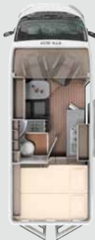
CV 600 BB