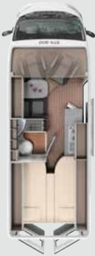
CV 640 SB