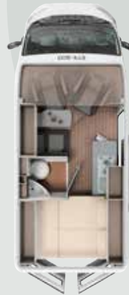
CV 540 DB