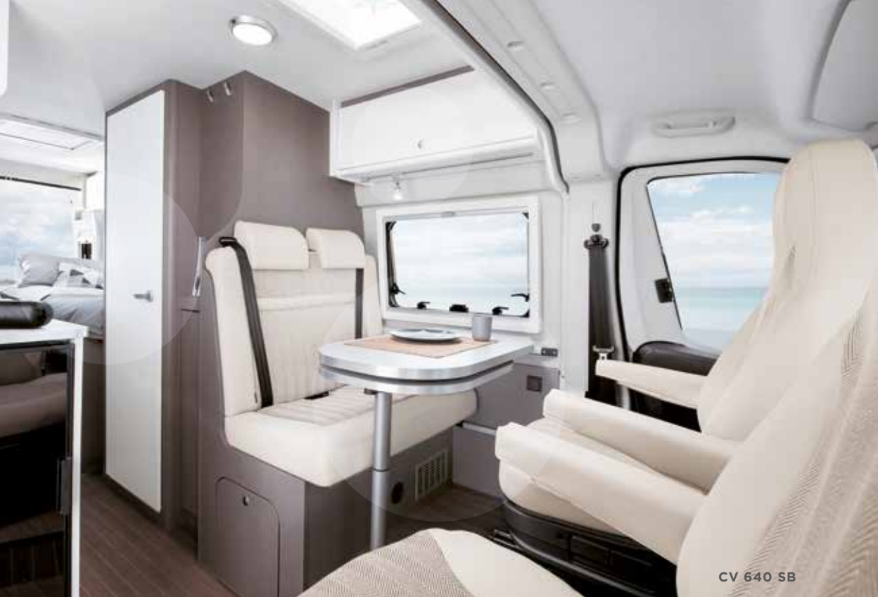
CV 640 SB