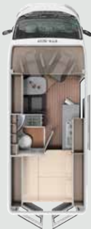
CV 600 DB